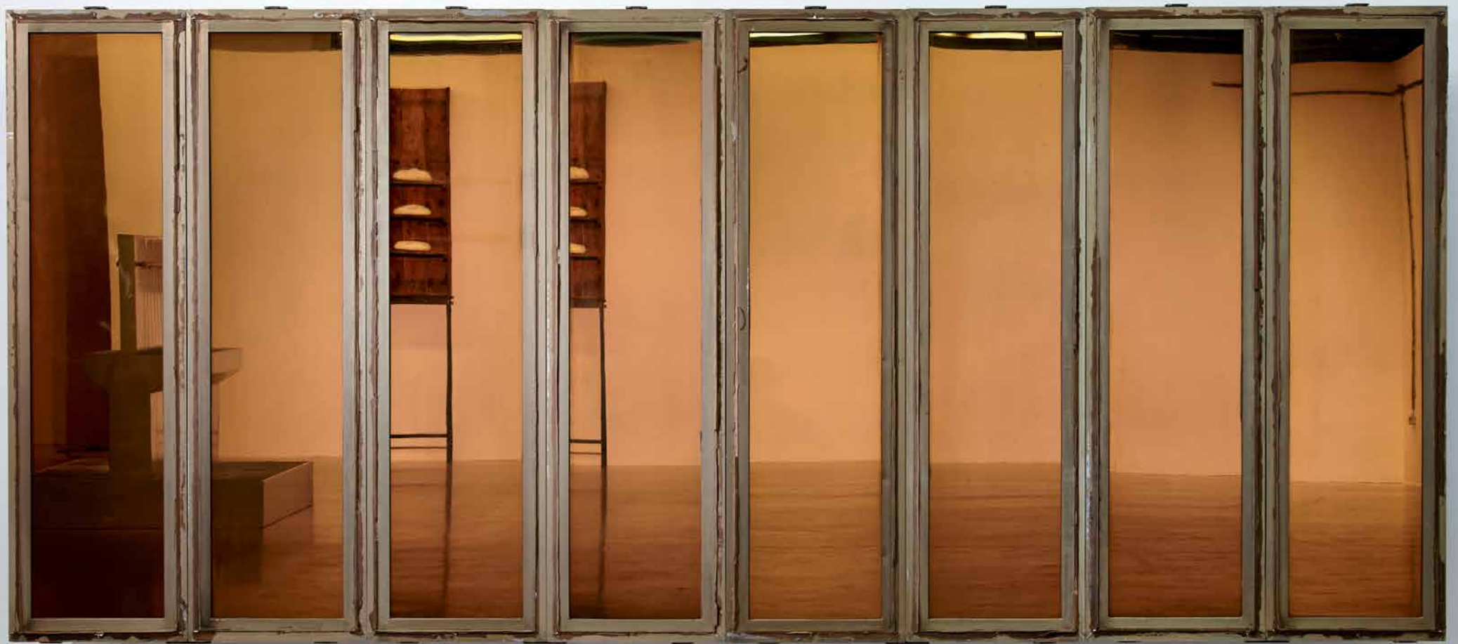
Der Traum von einer großen Sache / The Dream of Something Big, 2008

Städtische Galerie im Lenbachhaus, München // Fassadenscheiben vom ehemaligen Palast der Republik Berlin: Aluminium, Glas, Stahl / Front panels of the former Palace of the Republic Berlin: Aluminum, glass, steel_280 x 40 x 530 cm