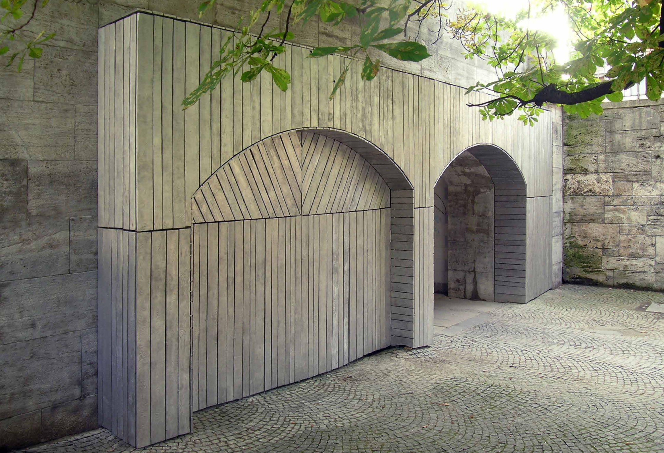
Tunnelfassade / Front, 2005 Ludwigsbrücke, München (Permanente Installation / Permanent installation) // Bretter (Aluminiumsandguss), Leuchtstoffröhren / Aluminium boards (sand casting), neon tubes_385 x 65 x 950 cm