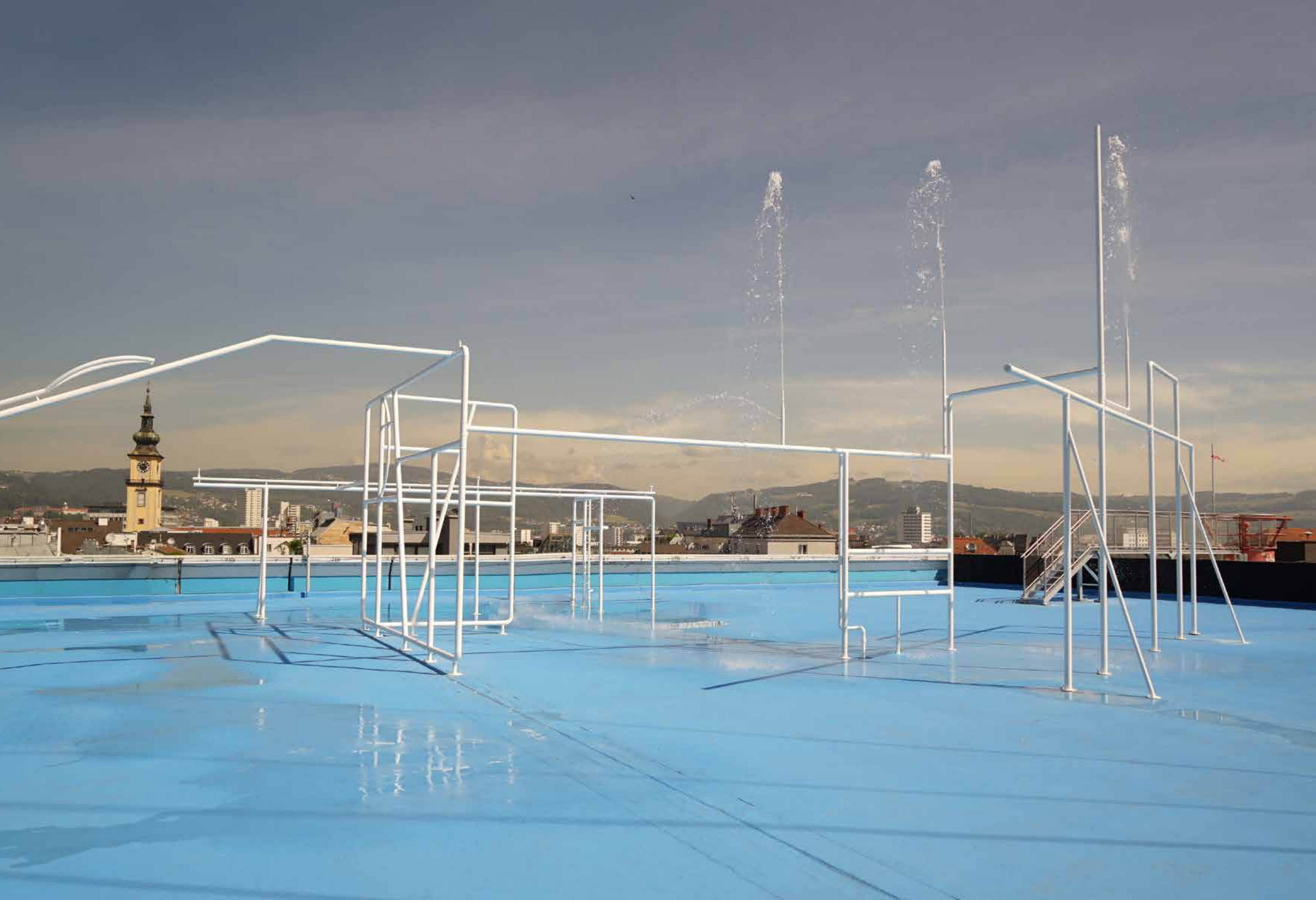
Fontana, 2018 Oberösterreichisches Kulturquartier // Parkdeck, Farbe, Stahl, Wasser, Brunnenpumpen, Steuertechnik / Parking deck, paint, steel, water, well pumps, dmx pump control _850 x 1900 x 1900 cm