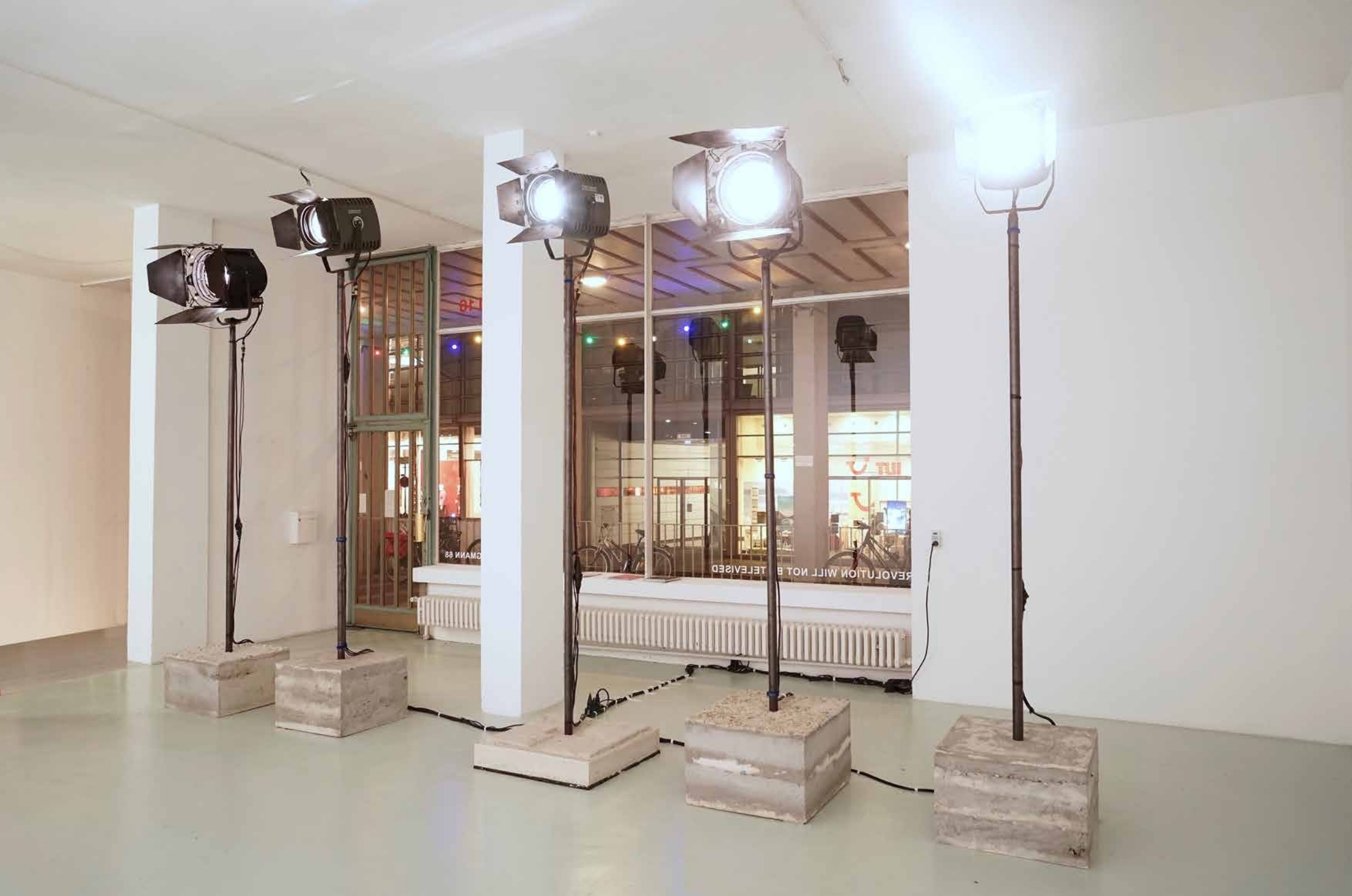
68_Revolution Will Not Be Televised, 2018 Artothek und Stadtmuseum, München // Beton, Stahl, LED-Scheinwerfer / Concrete, steel, led-spotlights_330 x 85 x 60x0 cm