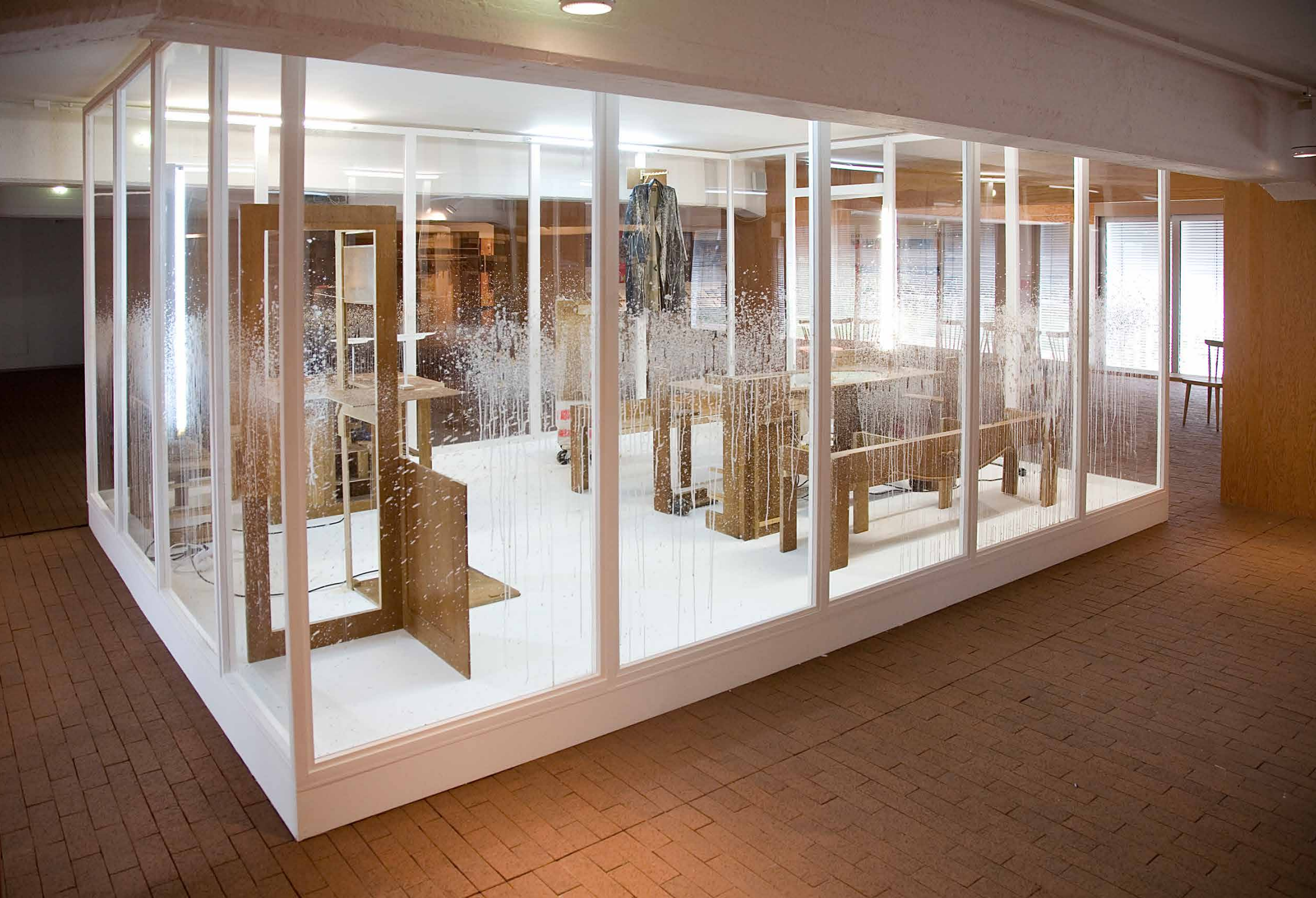
Fast-Food-Restaurant, 2012 MARTA Herford // Zersägter Eichenschrank, Kunststoffteller, Bohrmaschinen, Haferflocken, Wasser / Sawn up oak wardrobe, plastic plates, electric drills, oat flakes, water_300 x 550 x 400 cm