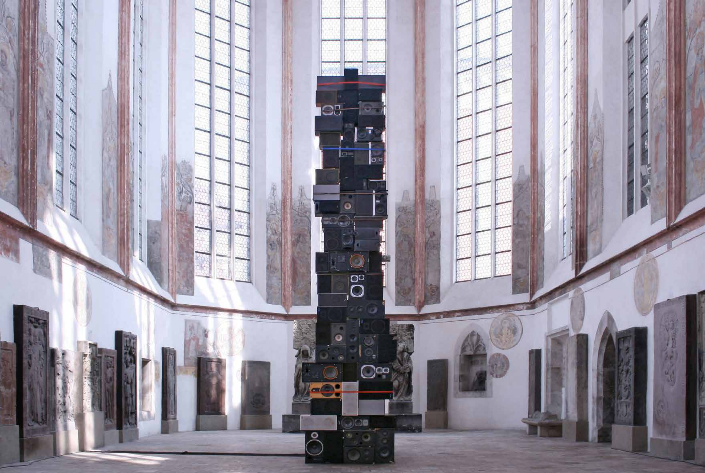
Box von Jericho, Private Version / Speaker of Jericho, Private Version, 2003

Minoritenkirche, Regensburg // Holz, Spanngurte, HiFi-Lautsprecher, Verstärker, digitaler Basston, digitaler Nullton / Wood, tension belts, HiFi speakers, amplifier, digital bass tone, digital zero tone_800 x 250 x 130 cm