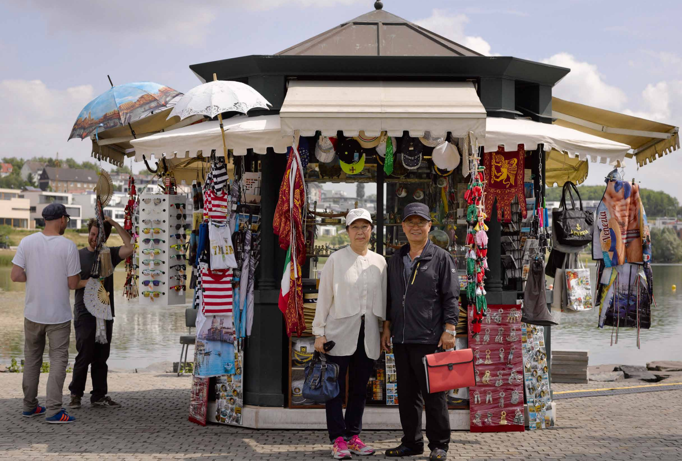
Chiosco, 2016 Phönixsee, Dortmund // original venezianischer Kiosk (Edicola No. 41), Baujahr 1987; ehemaliger Standort: S.Zaccaria (Pietà), Riva degli Schiavoni 4145, 30122 Venezia, Italien // Edelstahl, Kupfer, Marmor, venezianische Souvenirs und Postkarten, limitierte Künstlerpostkarten, italienische Zeitschriften, „Aqua frizzante San Benedetto“, „Aranciata Sanpellegrino“, „Langnese Capri“-Eis, italienische Musik_350 x 310 x 310 cm