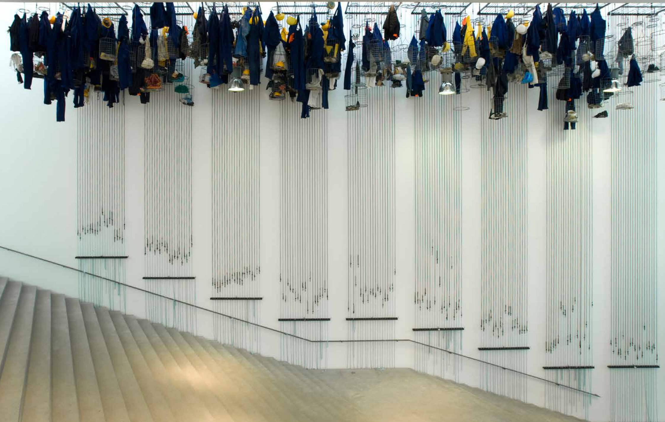
tief unten tag hell / deep down bright day, 2008 Pinakothek der Moderne, München // Stahl, Ketten, Arbeitskleidung, diverse Gegenstände / Steel, ropes, chains, working clothes, various objects_1400 x 2000 x 300 cm