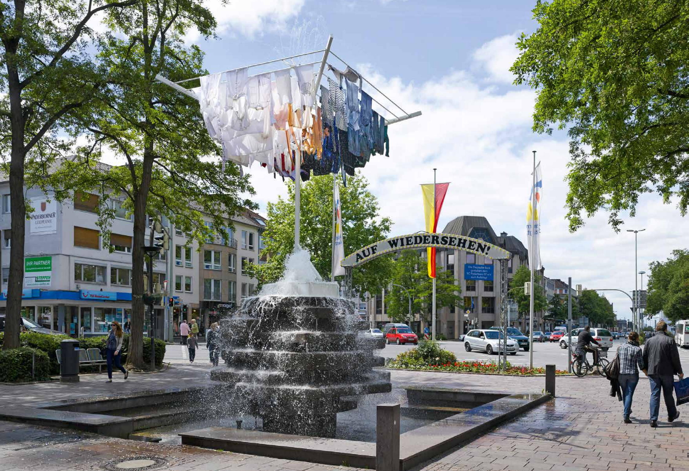
Wäschespinne / Clothes Drying Rack 2014 Westernstraße, Paderborn // Stahl, Kleidung, Brunnenpumpe / Steel, clothes, well pump_460 x 400 x 400 cm