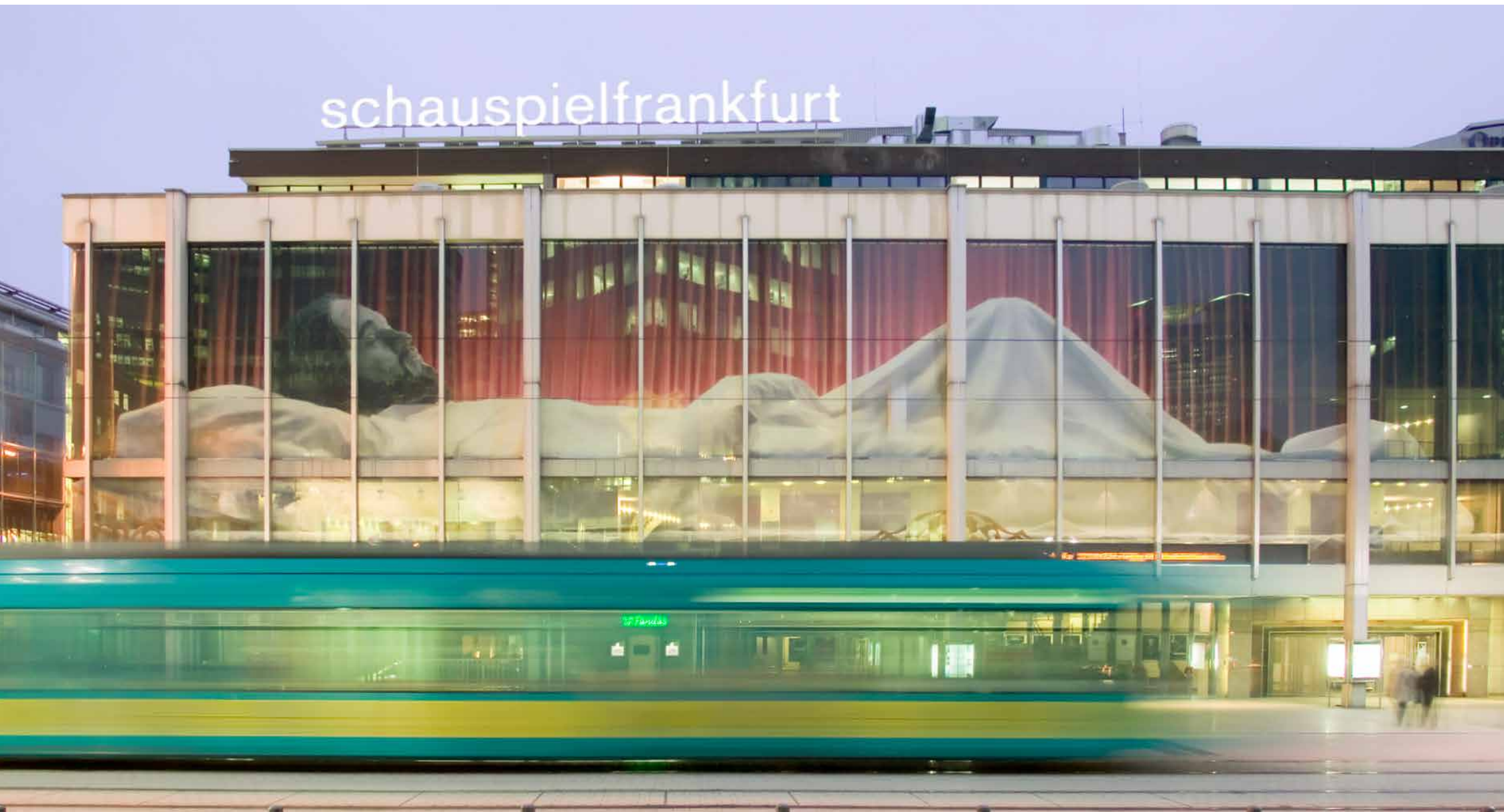
Theatrum Sacrum, 2005 Schauspiel Frankfurt, Frankfurt a. M. // C-Prints, Lichtsystem / C-prints, lighting systems_1600 x 1000 cm und 5200 x 1000 cm