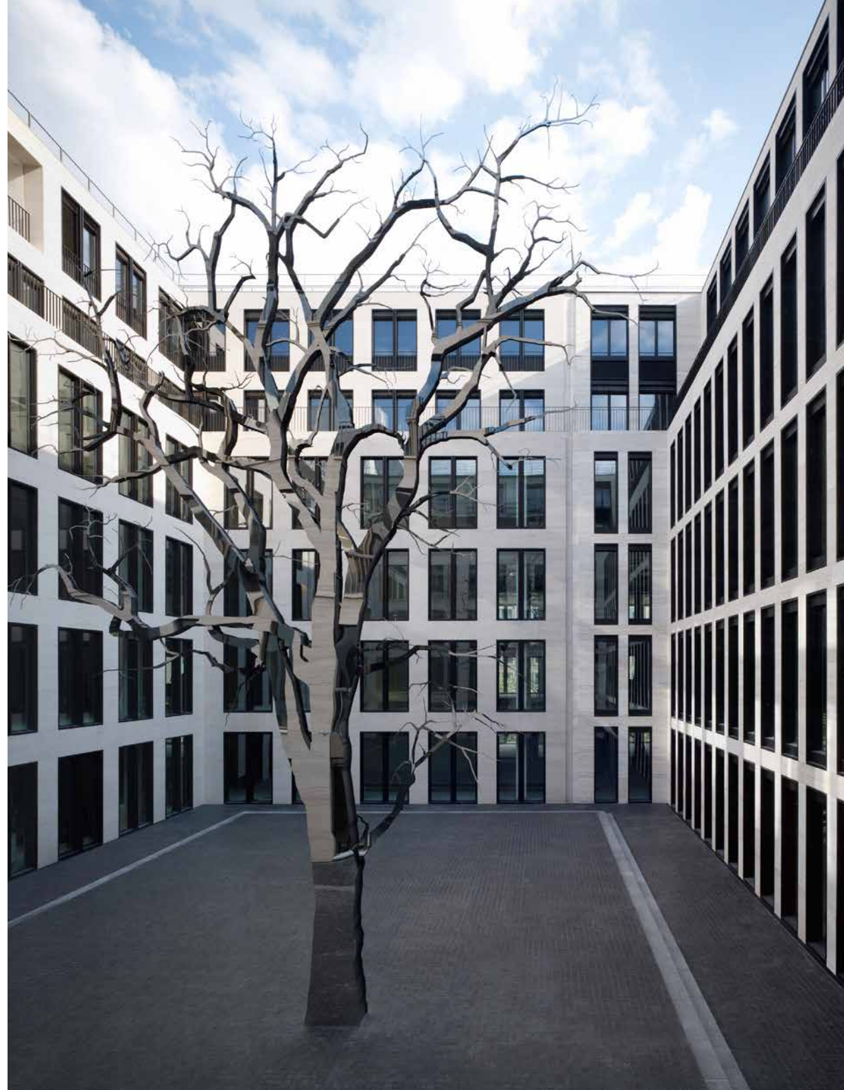
Licht und Schatten / Light and Shadow, 2009 Upper Eastside, Berlin Stahl, polierter Edelstahl, Lack / steel, polished stainless steel, lacquer_1400 x 950 x 40 cm