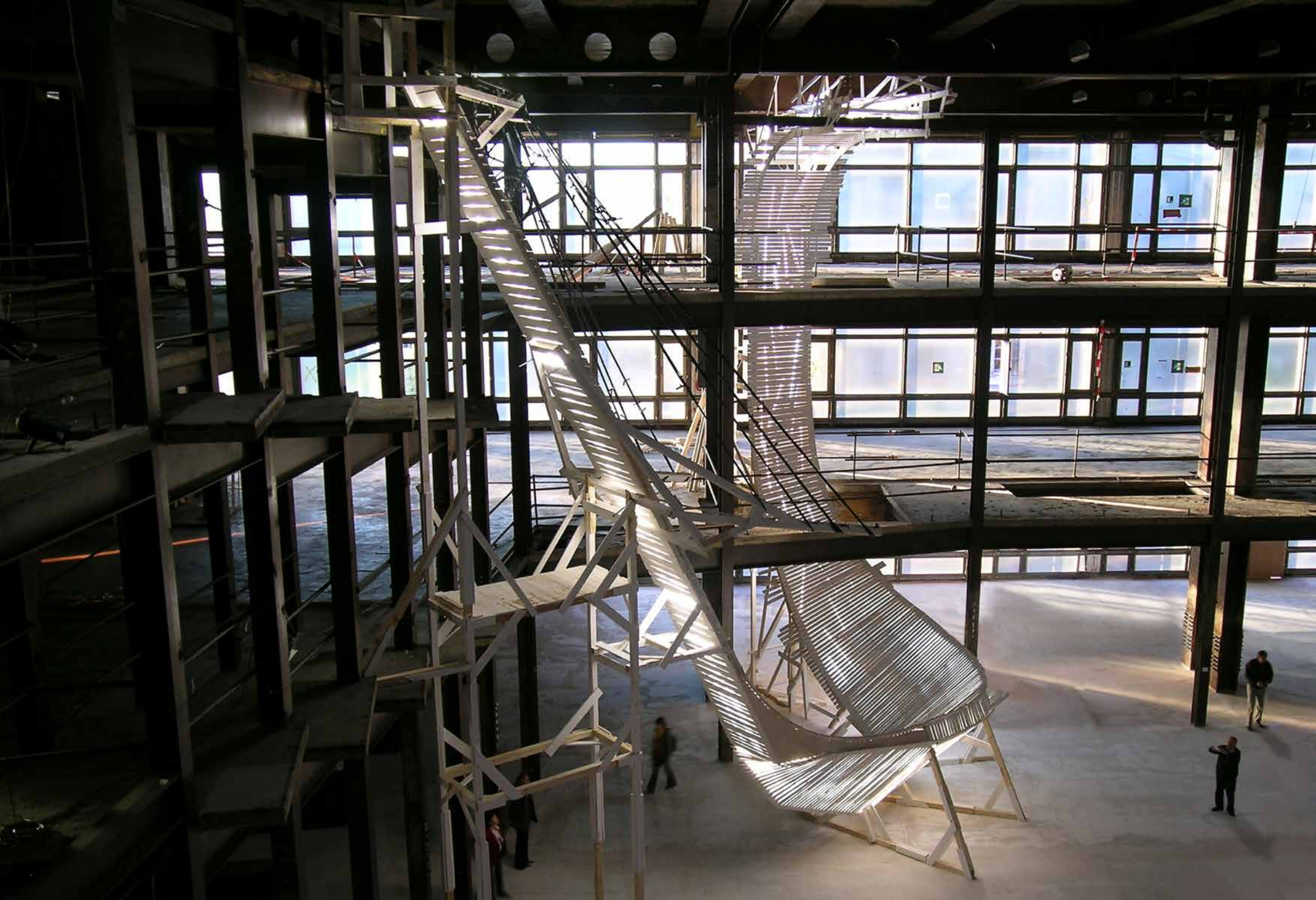
Hals über Kopf / Neck Above Head, 2005 Palast der Republik, Berlin // Holz, Fahrrad, Gummibänder, Leuchtstoffröhren, Farbe / Wood, bicycle, rubber bands, neon tubes, paint_1500 x 1200 x 1800 cm