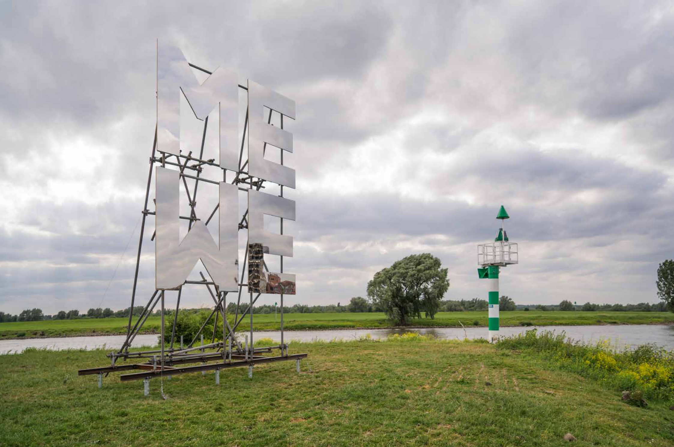
ME WE, 2017 Ijsselbiennale, Deventer, NL // Stahl, Edelstahlspiegel / Steel, stainless steel / _650 x 130 x 480 cm