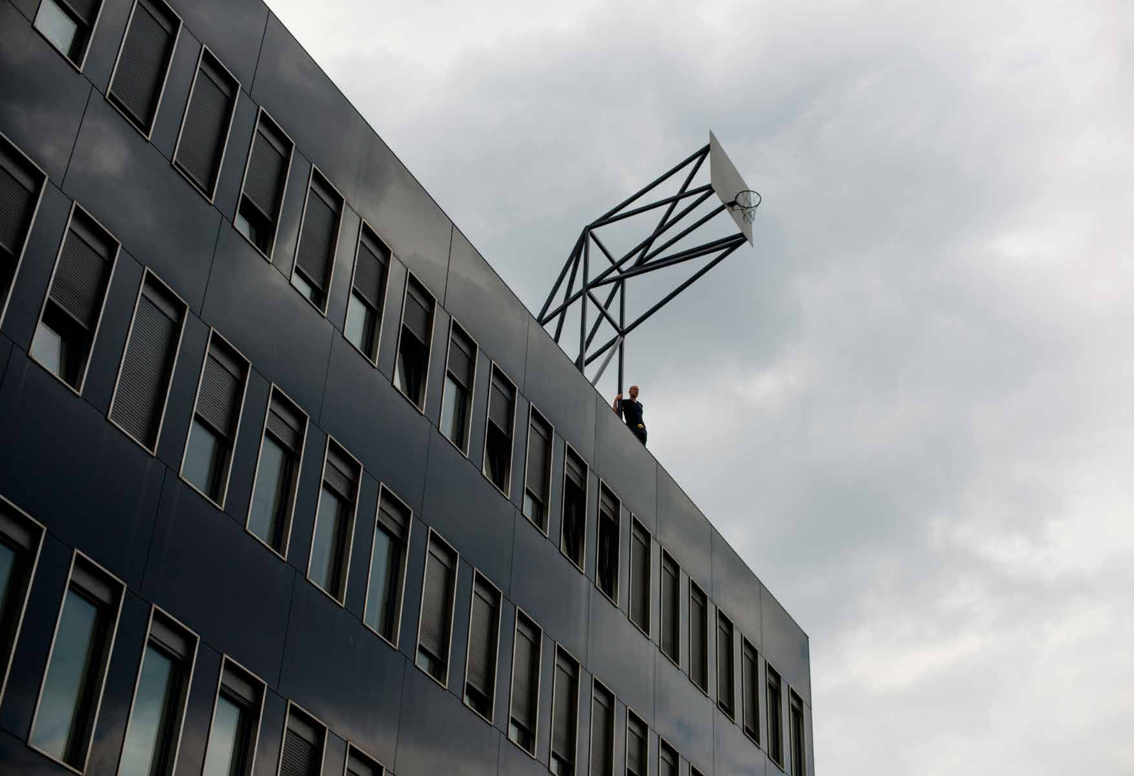
Never Ever, 2012 Leibnitz Rechenzentrum, Technische Universität, München // Basketballkorb, Stahl, Farbe / Basketball basket, steel, colour_650 x 480 x 180 cm