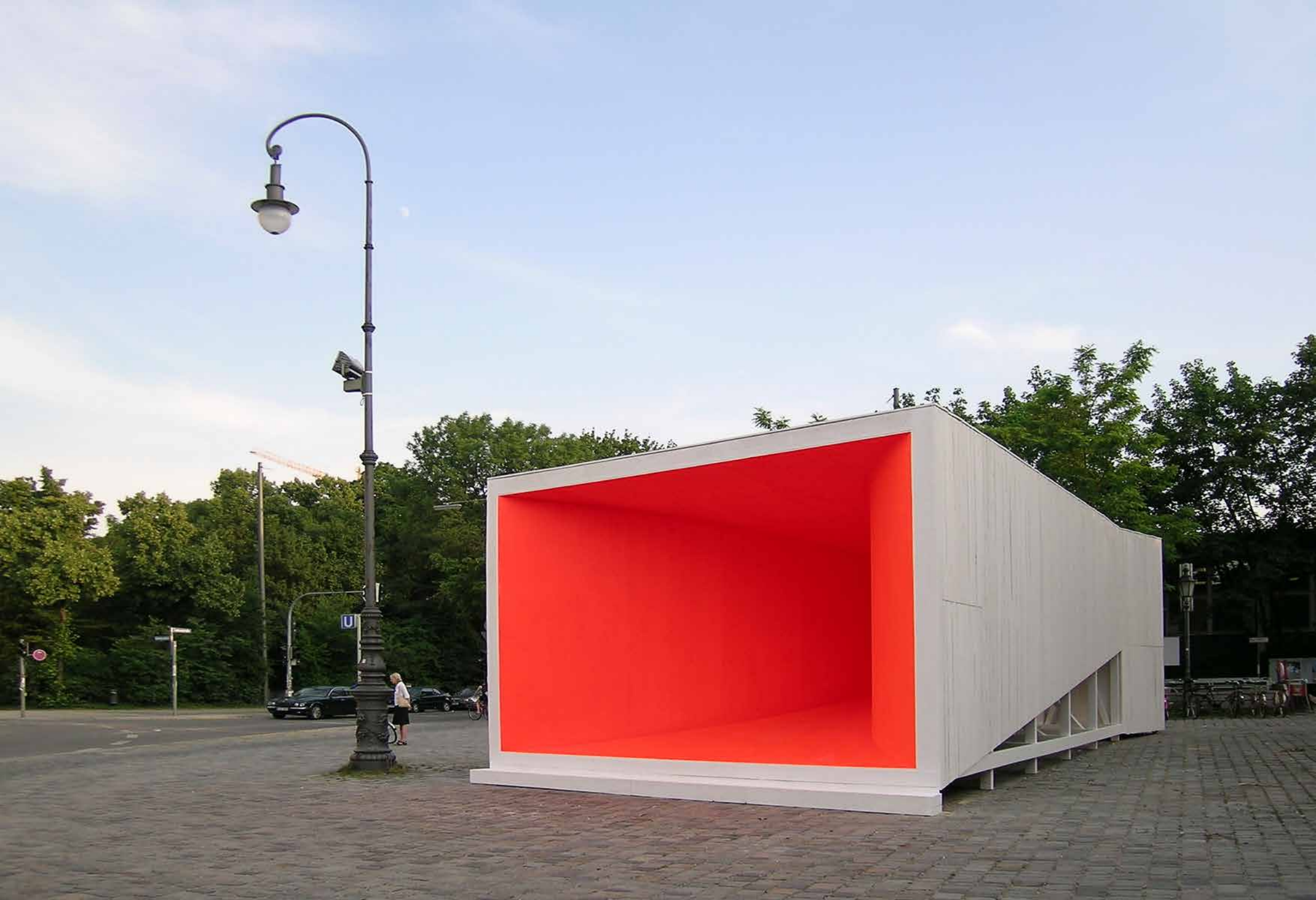
Beben / Quake, 2006 Städtische Galerie im Lenbachhaus, München // Holz, Farbe, Basslautsprecher, digitaler Basston, digitaler Nullton / Wood, paint, bass speakers, digital bass tone, zero tone, amplifier_420 x 1320 x 630 cm